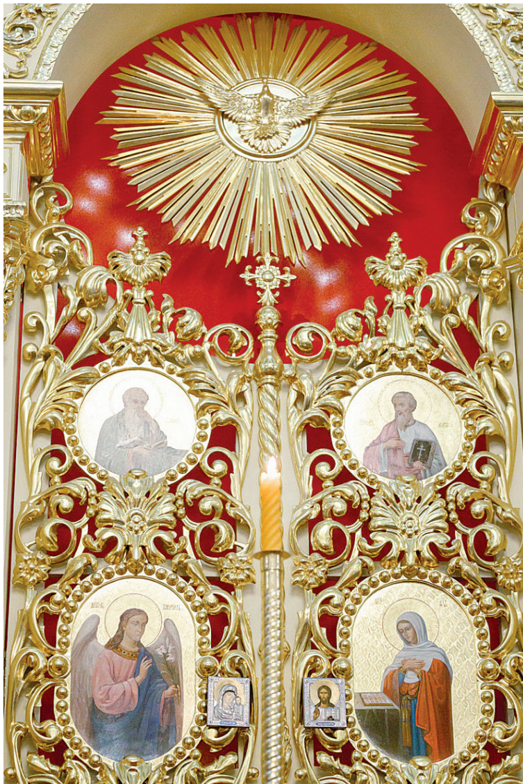
Невысокая алтарная преграда в древних храмах, завеса или высокие многоярусные русские иконостасы с царскими вратами искусной резьбы — все это служит отделению «святая святых» православного храма и символизирует соединение мира дольнего с миром горним в таинстве Евхаристии

Подытоживая краткий обзор восстановленных чинопоследований Литургии, основанных на древних обрядах, хочется заметить, что у нас не было цели обнаружить их «неполноценность», «неправильность» или, напротив, подчеркнуть их некие мнимые преимущества относительно «канонических» чинов. Единственным бесспорным и несомненным преимуществом привычных нам Литургий византийского обряда является то, что эта литургическая традиция никогда не прерывалась, благодаря чему сохранялась на протяжении веков сама жизнь Церкви как евхаристическое соединение человека и Бога. Подавление других, не менее красивых и древних чинов имело в свое время во многом политическую подоплеку. Но для нас с вами это никак не умаляет самоценность той самой Литургии, за которой мы снова и снова собираемся помолиться в обществе братьев и сестер по вере, наполненной бесконечностью символов и смыслов. А наличие в современной жизни Церкви различных богослужебных обрядов пусть напоминает нам о ее вселенском характере, служит подтверждением открытости Церкви культурному и национальному разнообразию — всему, что не противоречит евангельской истине. Ведь, как учил святитель Григорий Двоеслов, «в единой вере нисколько не вредит Святой Церкви разный обычай».