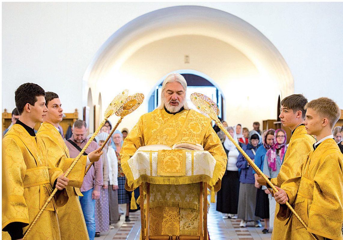
Провозглашение Слова Божьего — символ проповеди Христа в любой литургической традиции

Рассматривая подобные примеры возрождения служения Божественной литургии по древним чинам, невозможно не задаться вопросом о месте в православном богослужении западного обряда, на протяжении более чем тысячелетия бывшего неотъемлемой частью православного мира. Более того, и после Великого раскола 1054 года западный обряд продолжал практиковаться Православной Церковью на протяжении почти трех веков.