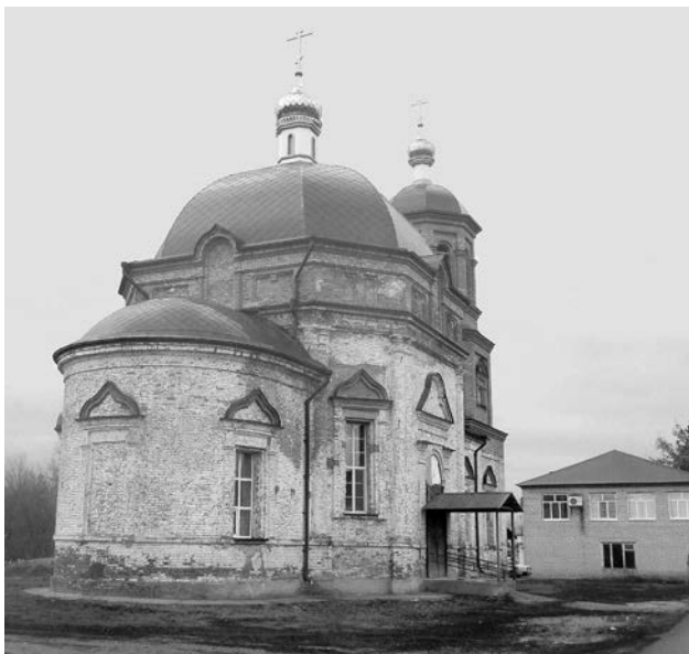
Храм в честь Казанской иконы Божией Матери с. Сухой Карабулак