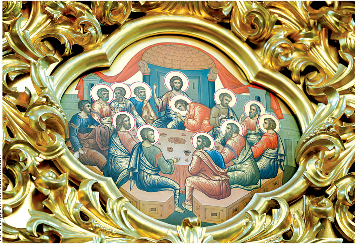
За всеми различиями чинов Литургии стоит одна и та же суть: Христос, преподающий Себя ученикам. Разные обряды — разные ракурсы взгляда на одну и ту же Тайную Вечерю

В 1977 году в Антиохийское викариатство западного обряда был принят епископальный приход в Детройте, который первым начал совершать Литургию Патриарха Тихона. Эта Литургия основана на англиканском богослужении, из которого была удалена неправославная вставка в текст Никейского Символа веры, добавлены молитвы за усопших, обращение к святым и усиление епиклезы (призывания Святого Духа на Дары в евхаристической молитве), а также молитвы перед причащением из византийского обряда. Этот чин и поныне практикуется большинством приходов Антиохийского викариатства.